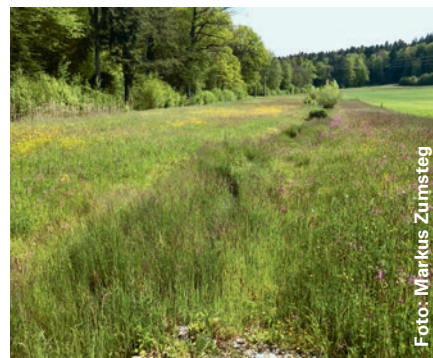
Wenn bei Wiesenbächen die Hochstauden an den Ufern bis im Herbst stehen gelassen werden, wird die Wasserfläche beschattet.

Die Hinweiskarte «Beschattung Fliessgewässer Aargau» dient als Grundlage für die Ermittlung des Handlungsbedarfs und der Lokalisierung von Potenzialgebieten für die Verbesserung der Beschattung der Gewässer. Lokale Gehölzpflanzungen können im Rahmen von Unterhaltsmassnahmen am Gewässer, beim Abschluss von Labiola-Verträgen mit Landwirten oder bei Bepflanzungsaktionen auf kommunaler Ebene zum Beispiel unter Mitwirkung von Fischerei-, Naturschutz- oder Jagdvereinen erfolgen. Erste Ansprechpersonen sind in jedem Fall die Gewässerbeauftragten der Abteilung Landschaft und Gewässer.