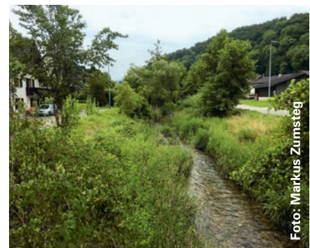
Dieser Bachabschnitt weist ein Mosaik von besonnten Uferpartien und beschatteten Abschnitten auf.

Die Hinweiskarte «Beschattung Fliessgewässer Aargau» dient als Grundlage für die Ermittlung des Handlungsbedarfs und der Lokalisierung von Potenzialgebieten für die Verbesserung der Beschattung der Gewässer. Lokale Gehölzpflanzungen können im Rahmen von Unterhaltsmassnahmen am Gewässer, beim Abschluss von Labiola-Verträgen mit Landwirten oder bei Bepflanzungsaktionen auf kommunaler Ebene zum Beispiel unter Mitwirkung von Fischerei-, Naturschutz- oder Jagdvereinen erfolgen. Erste Ansprechpersonen sind in jedem Fall die Gewässerbeauftragten der Abteilung Landschaft und Gewässer.